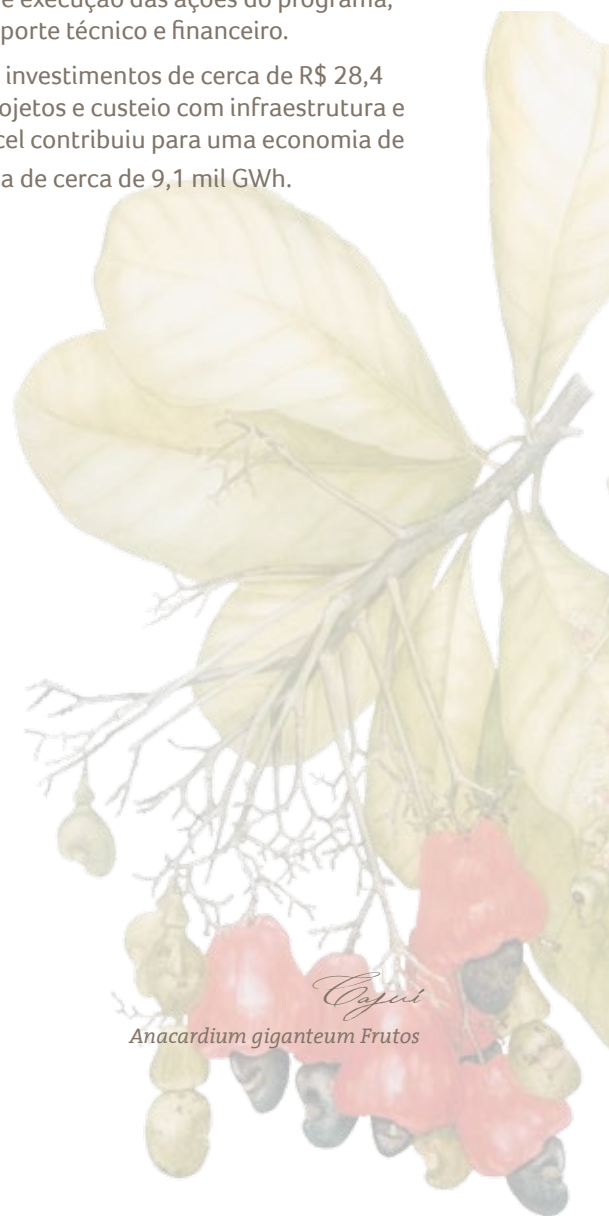
Cajuz Anacardium giganteum Frutos

Em 2012, com investimentos de cerca de R$ 28,4 milhões em projetos e custeio com infraestrutura e pessoal, o Procel contribuiu para uma economia de energia elétrica de cerca de 9,1 mil GWh.